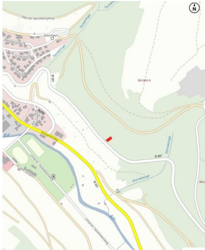
Lageplan FI.Nr. 1455/2