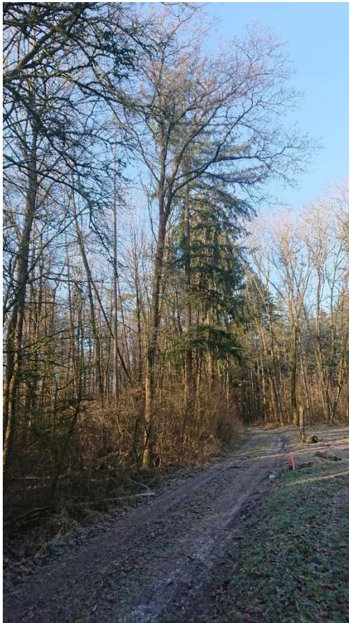
Ansicht Nordseite von Osten