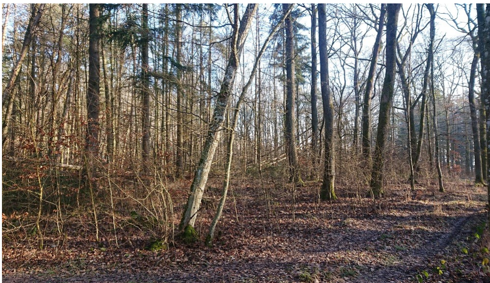
Ansicht Südseite von Südwesten