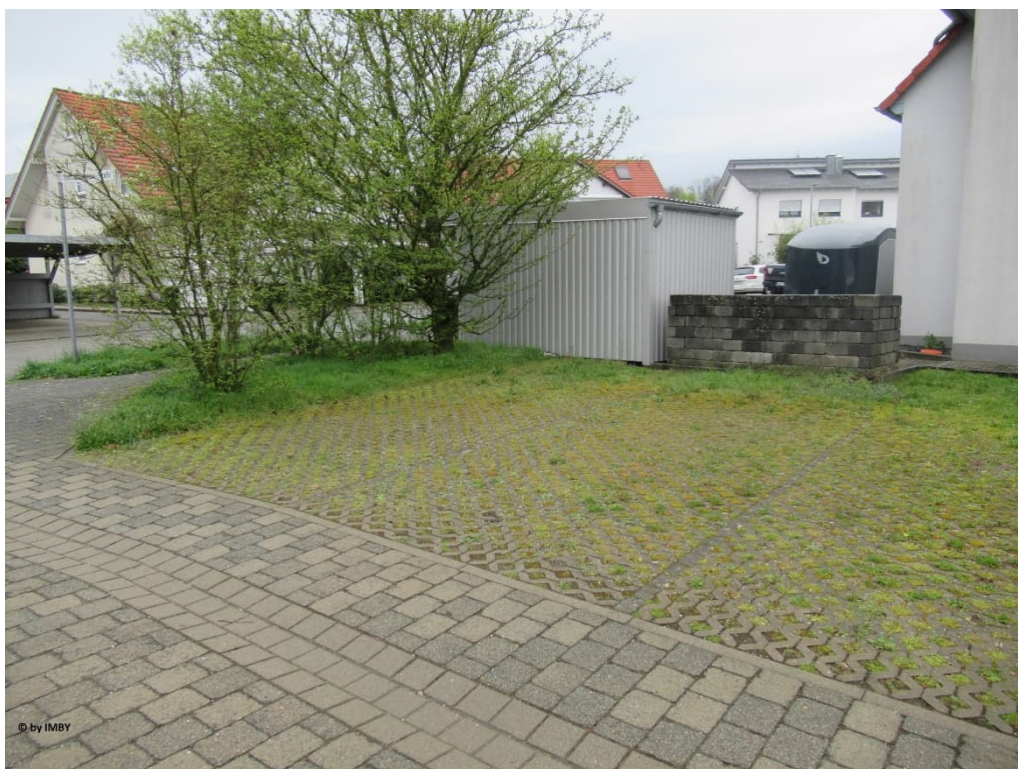
Ansicht von Onet-le-Chateau-Straße

2 PKW-Parkplätze 96135 Stegaurach, Onet-le-Chateau-Straße